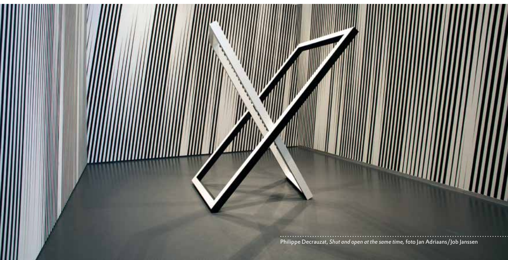
Philippe Decrauzat, Shut and open at the same time , foto Jan Adriaans/Job Janssen

Met Actie <-> Reactie presenteert de Kunsthal een origineel en historisch overzicht van kinetische kunst. Licht en beweging staan daarin centraal. Er is werk te zien van veel bekende pioniers zoals Duchamp, Vasarely, Calder en Tinguely maar ook van minder bekende namen. De geëxposeerde kunstwerken komen uit belangrijke collecties van Europese musea en zijn bijeengebracht door twee Franse gastcuratoren. Actie <-> Reactie is een ongelooflijk leuke en speelse tentoonstelling, die alle zintuigen prikkelt en de kijker onderdeel laat zijn van de kunstwerken.